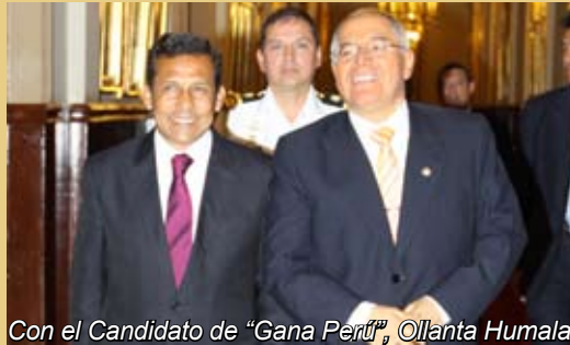
Con el Candidato de “Gana Perú”, Ollanta Humala.

Destacó el compromiso de los candidatos de respeto a la institucionalidad democrática, sobre todo en lo referido al sistema de justicia.