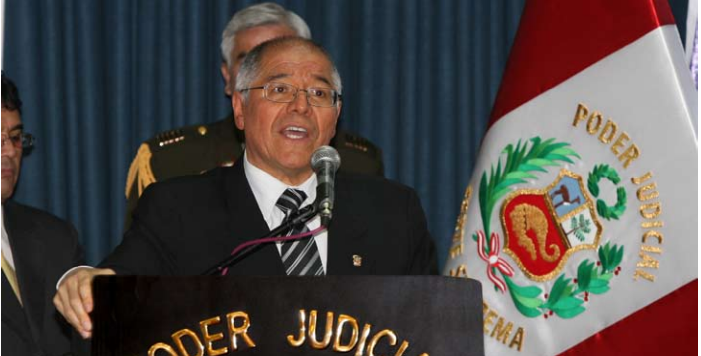
Presidente del Poder Judicial, Doctor César San Martín Castro.