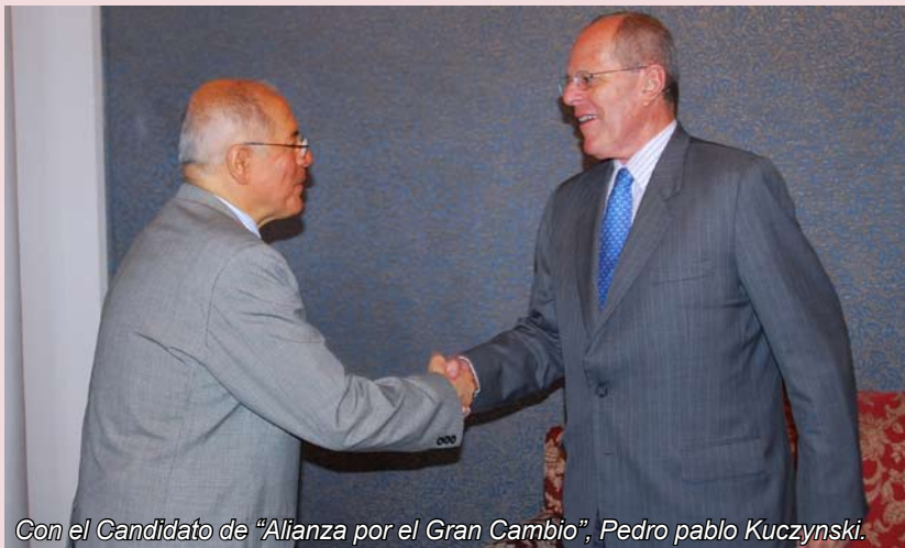
Con el Candidato de “Alianza por el Gran Cambio”, Pedro pablo Kuczynski.

ás, crear una estructura administrativa es-