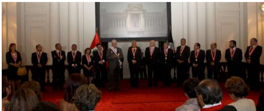
Mario Vargas Llosa y miembros de la Sala Plena de la Corte Suprema.

“Es un ejemplo y un símbolo de lo que todos los peruanos democráticos, honrados y decentes quisiéramos tener en todos los tribunales”, refirió. ■